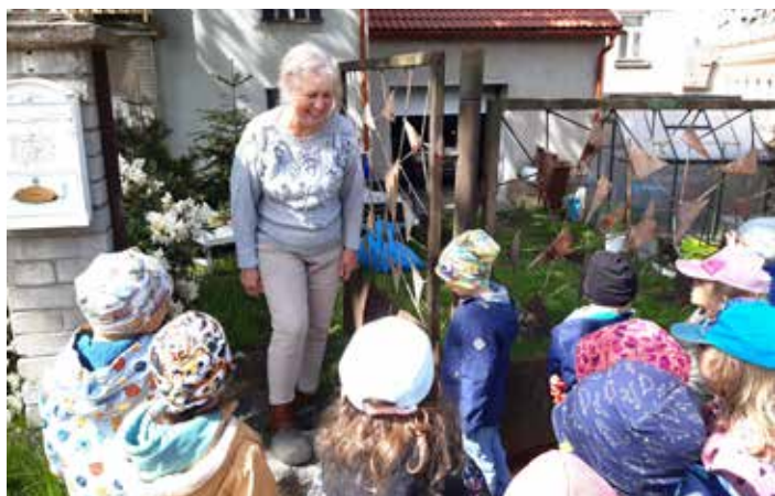
Sluníčka přála borovským seniorkám ke Dni matek.