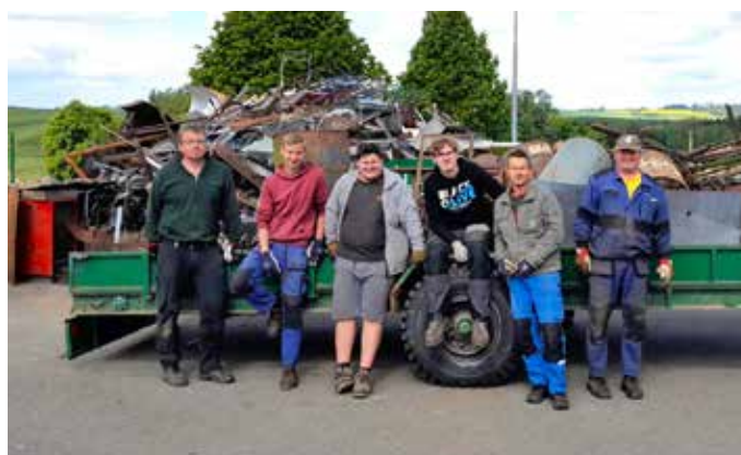
Sběr železného šrotu pořádají dobrovolní hasiči pravidelně v květnu a říjnu.