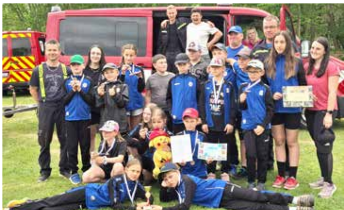
Oba hasičské týmy s vedoucími a doprovodem na soutěži v Sobínově. Více na str. 11.