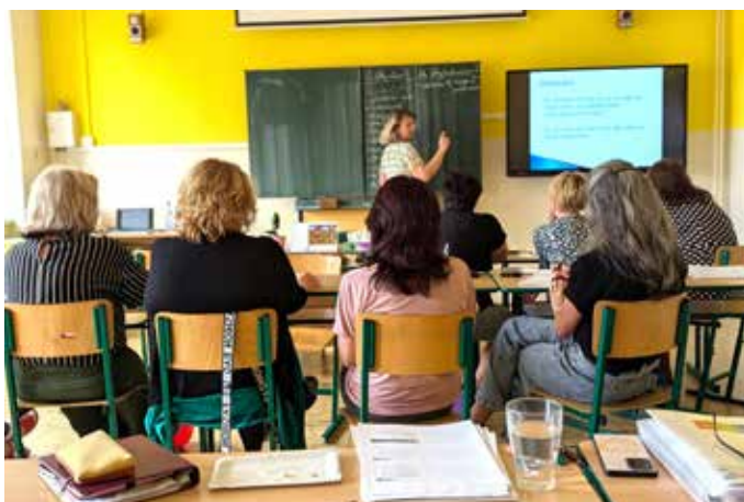
Vzdělávat se musí nejen děti, ale samozřejmě i pedagogové. Náš sbor během května absolvoval školení pod vedením zkušené lektorky na téma Diferenciace výuky.