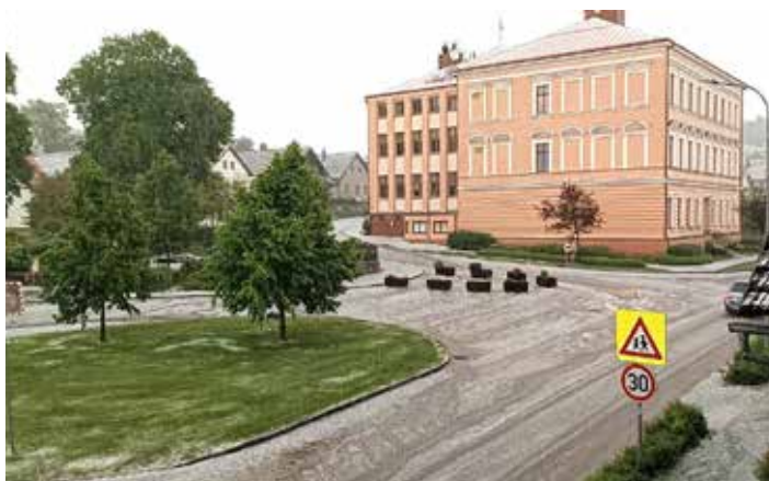
V půlce května zasypaly obec kroupy a zahrozila bouřka s deštěm. Na chvíli bylo všude bílo jako v zimě. Více na str. 5.