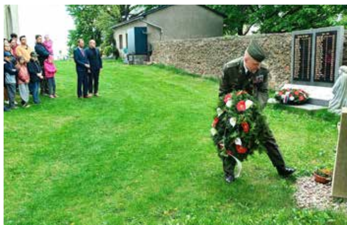
Osmého května se sešlo několik občanů u kladení věnců na hřbitově u příležitosti 80. let od konce 2. světové války.