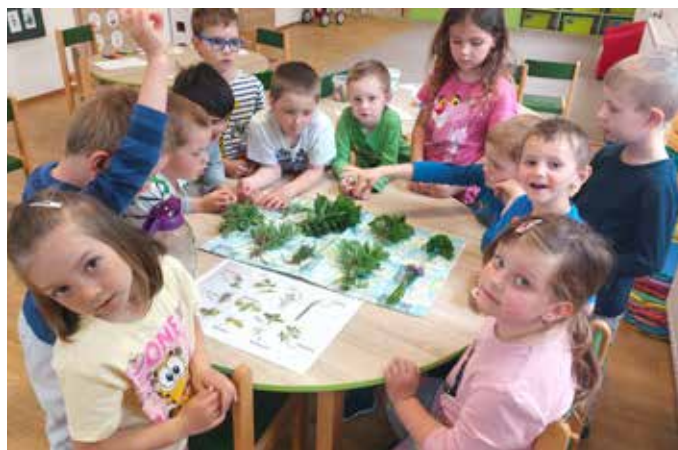
Žabky poznávaly bylinky podle vůně.