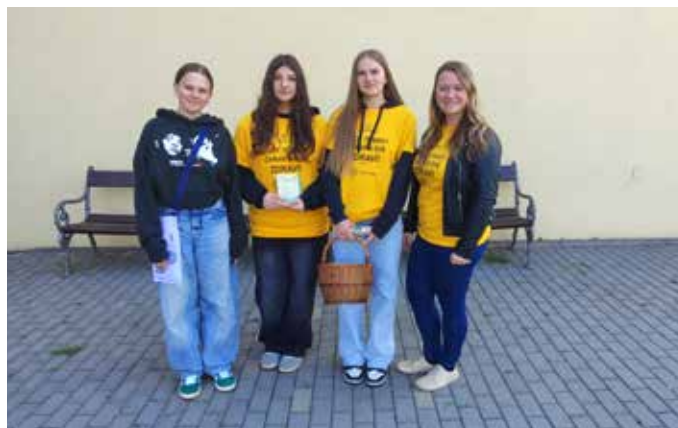
Letos proběhl už 35. ročník Českého dne proti rakovině a v Borové se letos vybralo krásných 6 364 korun.