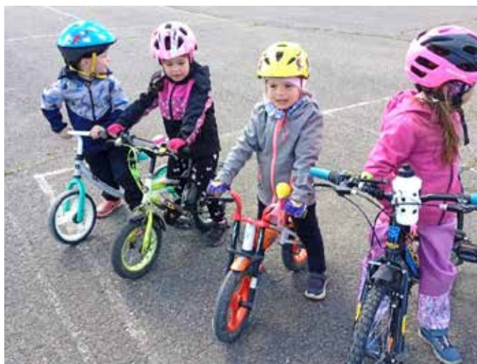
Motýlci na dopravním dopoledni.