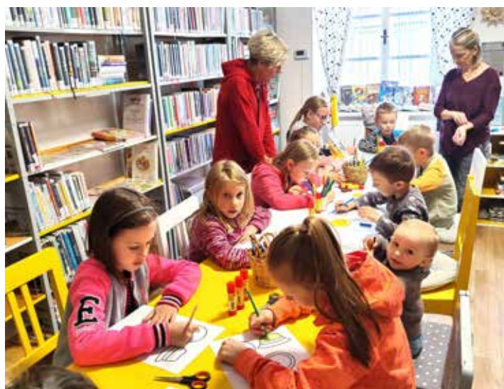
V rámci Odpoledne s pohádkou nejen čteme, ale také tvoříme - to děti vždycky velmi baví.