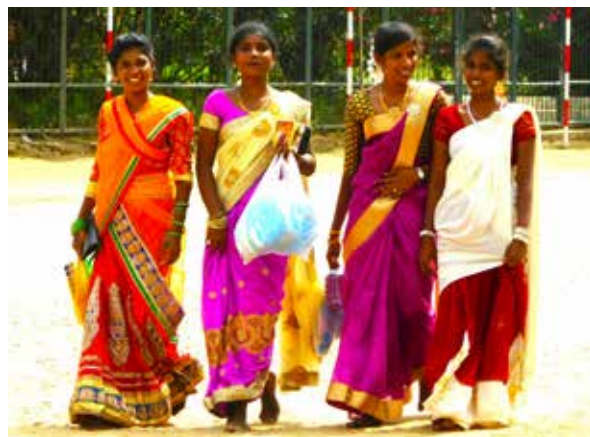
Dívky v tradičním sárí.