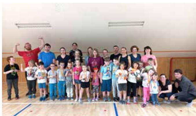
DĚTI NA STARTU si užily poslední cvičení letošního školního roku společně s rodiči. Více na str. 11.