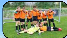
Fotbal, str. 13