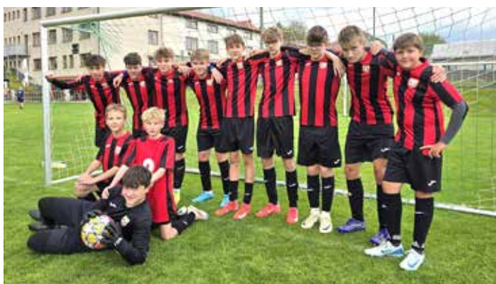
Starší žáci se stali mistry Okresního přeboru Havlíčkův Brod. V soutěži dosud neztratili ani bod!