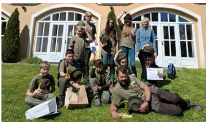
Devítičlenná výprava mladých myslivečků na soutěži Zlatá srnčí trofej ve Vilémově. Více na str. 10.