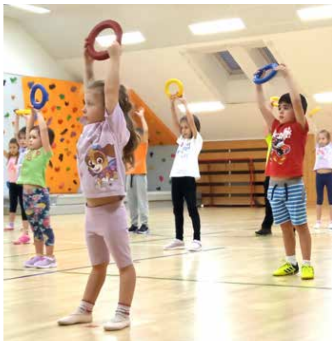
Děti při rozvíčce s ringo kroužky.