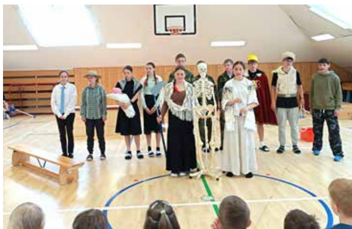
Žáci 8.ročníku zakončili čtenářský projekt s předškoláky poslední regionální pověstí O Hnátovi. Setkání se proměnilo v divadelní představení, po kterém nechyběly úkoly a stezka za pokladem.