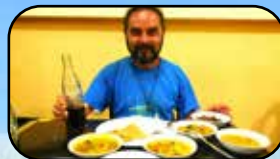
Promítání o Srí Lance, str. 10