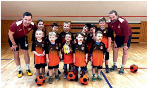
Fotbalová kategorie nejmenších, takzvaná U7, se pravidelně schází na tréninku a děti také hrají své první turnaje.