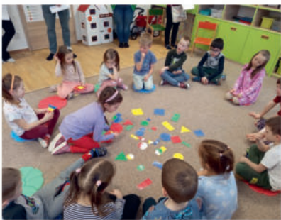
Setkání s rodiči Žabek před zápisem - Žabky procvičují geometrické tvary.