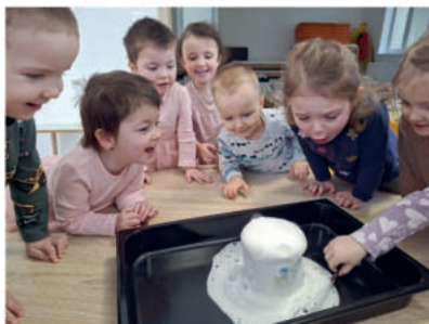
Sluníčka a kouzelný hrneček