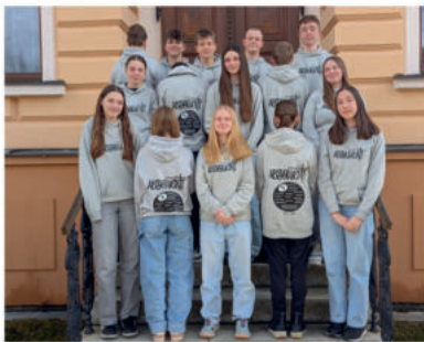
Městys Havlíčkova Borová oblékl devátáky do stylových mikin. Děkujeme!