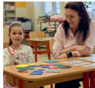
U předškoláček vládla na zápisu do první třídy dobrá nálada, v září jich dorazí 19.