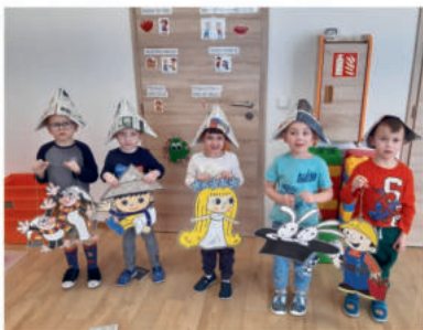
Pohádkový týden u Motýlků