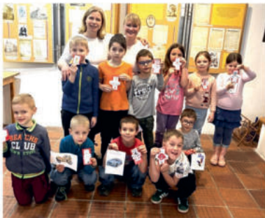
Děti z mladší družiny tvořily v knihovně překrásné valentýnky. Snad z nich měli radost i ti obdarovaní.

Knihovna Havlíčkova Borová vás srdečně zve na přednášku