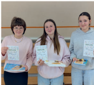
Při školním kole recitační soutěže předvedli žáci prvního i druhého stupně působivé výkony.