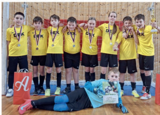
U11 se představila na turnaji v Příbyslavi, kde obsadila druhé místo.