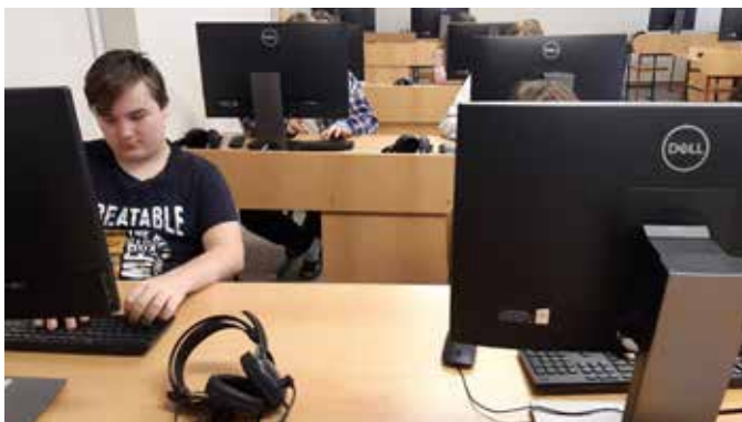
Osmáci v nové počítačové učebně.