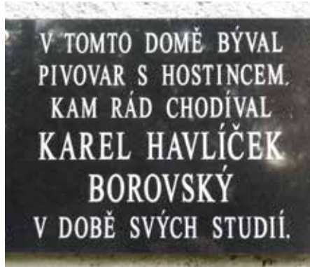
Havlíčkův Brod – ulice Rozkošská

studenty pořádaných zábavách, během nichž se tancovalo a zpívalo. Budova nacházející se při Rozkošském potoku na jeho levém břehu asi 700 metrů od místa, kde se vlévá do řeky Sázavy, doznala od Havlíčkových dob pochopitelně zásadnějších změn své podoby. Pamětní deska, která v poměrně nedávné době nahradila původní plechovou desku, je k vidění nikoli na průčelí budovy do ulice, ale ze strany stavby při pěšině podél Rozkošského potoka. Deska je umístěna na rohu budovy ve výšce dvou a půl metrů nad zemí a je na ní tento text: „V TOMTO DOMĚ BÝVAL PIVOVAR S HOSTINCEM, KAM RÁD CHODÍVAL KAREL HAVLÍČEK BORO VSKÝ V DOBĚ SVÝCH STUDIÍ.“