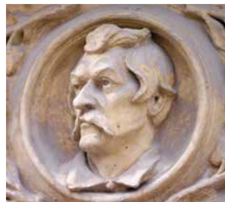
Kutná Hora – ulice Na Náměti