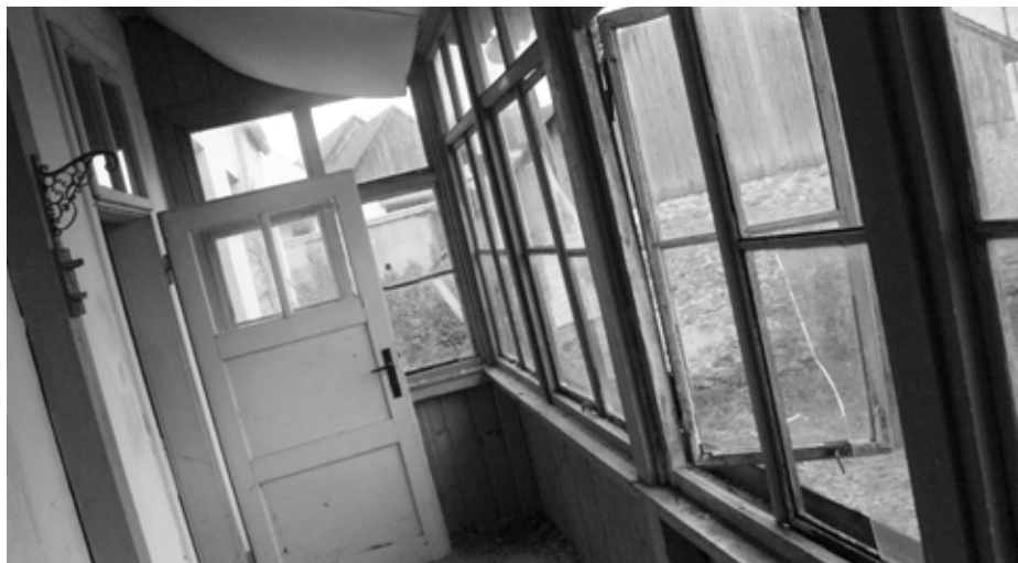
Dům se na jihovýchodní straně pyšně nádherou dřevěnou pavlačí.