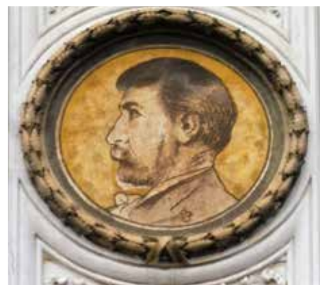
Praha – Jindřišská ulice

jenž se mezi lety 1896 až 1938 a ještě krátce po 2. světové válce jmenovalo po Karlu Havlíčkovi, je nedaleko gotické Jindřišské věže čtyřpatrový dům č. 1694/29. Mezi okny jeho posledního patra, tedy ve výšce přibližně 15 metrů nad chodníkem, je vyobrazena čtveřice osobností, mezi kterou najdeme i Karla Havlíčka. Ten se nachází zcela napravo a vskutku vybranou společností mu zde dělají zleva: Josef Jungmann, František Ladislav Rieger a František Palacký. Obraz Havlíčka je stejně jako obrazy ostatních kruhového tvaru o průměru asi 80 cm a zasazen do štukového orámování s rostlinnými motivy. Havlíček je zde zobrazen z levého profilu a v hnědé barvě na okrovém pozadí. Zajímavostí je, že zde má malý plnovous, který si, jak uvádějí některé prameny, nechal Havlíček narůst po svém návratu z Brixenu. Asi jeden metr nad obrazem Havlíčka je pak z úrovně chodníku díky světlému nápisu na šedém podkladě špatně rozpoznatelný a bez přiblížení teleobjektivem prakticky nečitelný nápis „HAVLÍČEK.“, takže přestože Borovský zde nemá svojí nejtypičtější podobu, není tu o zobrazení právě jeho žádných pochyb. V úrovni tohoto nápisu je od něj napravo při hraně domu ještě datování jeho stavby nápisem: „L. P. 1888.“