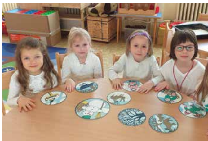
Holčičky ze třídy Berušek nad zimními obrázky.