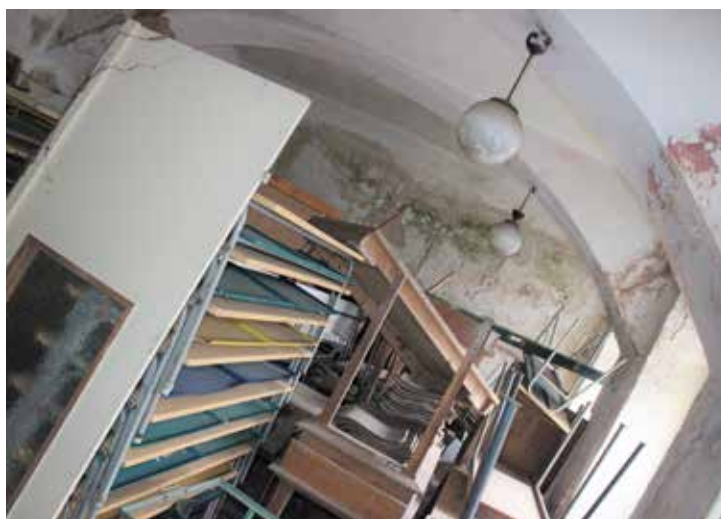
Pamatujete si skautskou klubovnu? Nyní je většina přízemí zrovnána přebytky ze základní školy – lavicemi, tabulemi a židlemi, nechybí staré mapy i vybavení učeben chemie a fyziky. Tak možná to využijeme na další retrovýstavu...

N a h o ř e v patře byla za války a po válce četnická s t a n i c e : Místnost pro č e t n i c t v o , místnost pro velitele a byt velitele četníků. Za války a po válce byl velitelem pan Hanuš, mužstvo tvořil Ladislav Frýbert (jméno má více variant,