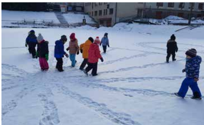
Sluníčka vyšlapují cestičky ve sněhu.