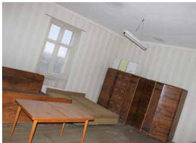
Sem jsme chodili k panu Matějovi půjčovat knihy. Vzpomínáte?

jak se mohlo psát) a pan Imramovský, a třetí asi pan Zadina.