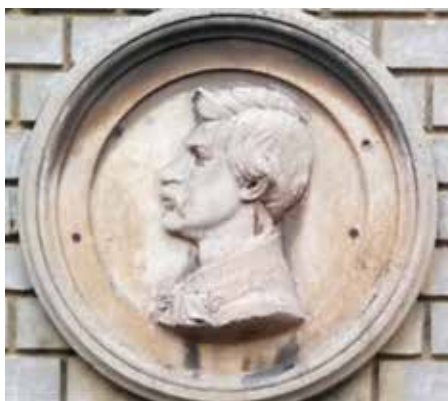
Praha – ulice Na Václavce