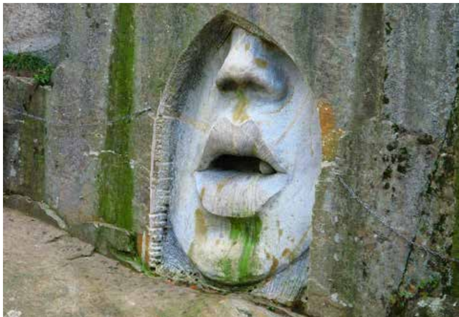
Ústa pravdy jsou součástí lipnického triptychu nazvaného Národní památník odposlechu.