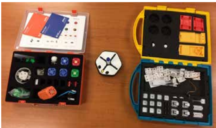
Ukázka robotické stavebnice.