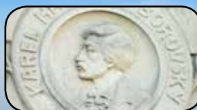
Památky na KHB, str. 10