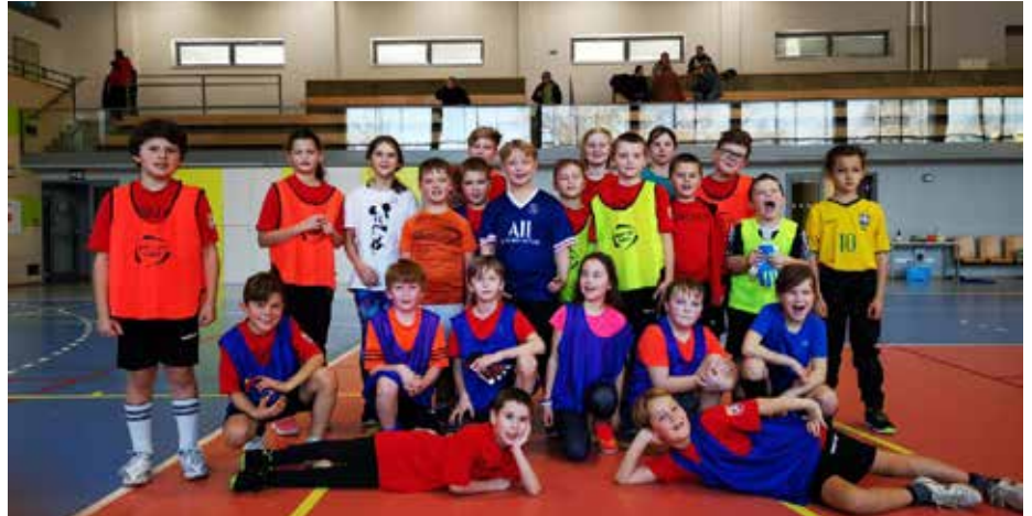
Týmy fotbalové přípravy z Havlíčkovy Borové dojíždějí na tréninky do haly ve Světlé nad Sázavou, kde našly skvělé podmínky.