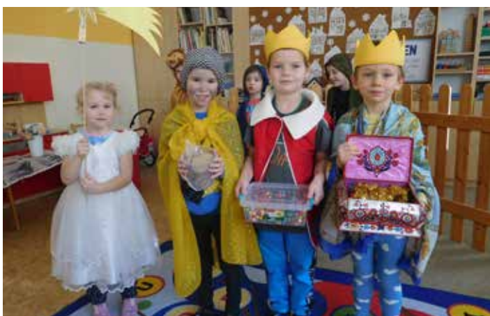
Svátek Tří králů u předškoláků.