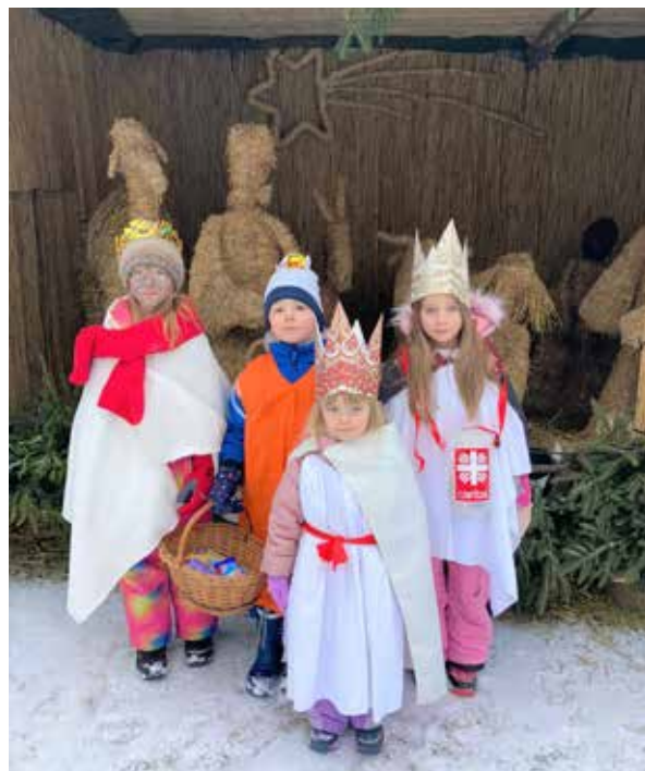
Tři králové prošli také celým Peršíkovem.