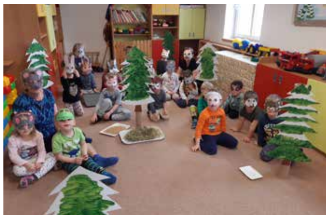
Třída Sluníček se proměnila na les plný zvířátek.