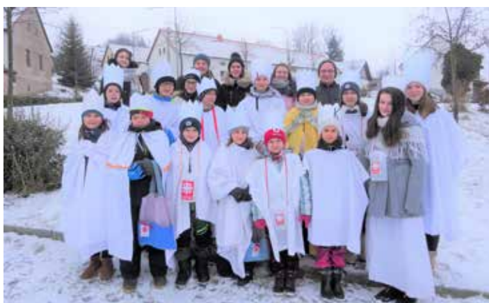
Skupinky Tří králů procházely obcí na začátku ledna a po ložské pauze tak opět psaly na veřeje domů K+M+B.