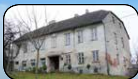
Mrázkovo, str. 6

www.havlickovaborova.cz * urad@havlickovaborova.cz * 569 642 101