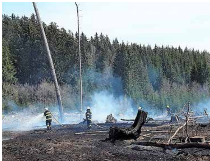
Borovští hasiči v roce 2021 mimo jiné zasahovali u lesních požárů.

aktuálně 21 členů a je tvořena velitelem jednotky, třemi veliteli družstev, sedmi strojníky (plánované navýšení počtu strojníků na 7 bylo realizováno teprve vloni s ročním zpožděním) a deseti hasiči. Patnáct členů jsou nositelé dýchací techniky a čtyři jsou proškolení pilaři. Dále v jednotce působí tři profesionální hasiči.