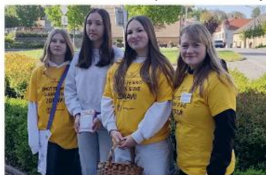
Velké díky patří holčám z deváté třídy, které pomohly s pořádáním sbírky Český den proti rakovině. Vybralo se krásných 7227 korun.

Pro příznivce napětí jsme zadali několik poutavých titulů – českou detektivku Zapalte hranici od Jany