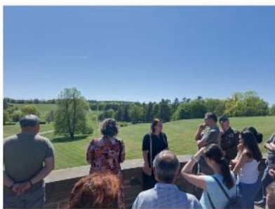
Pohled na místo, kde stávaly Lidice.