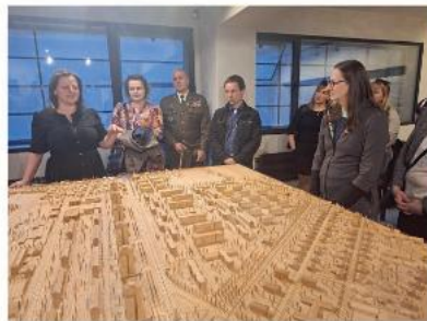
Muzeum věžáků, model Kladna.