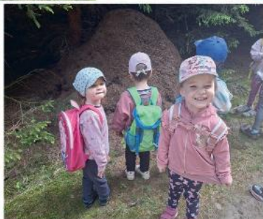
Vycházka k mraveništi.