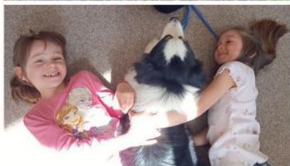
Asistenční psi u Žabek, ukázka canisterapie.