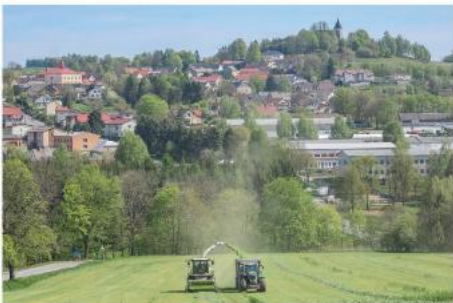
Počasí - poslední dubnový den o čarodějnicích velká zima a vítr, od 1. května se to zlomilo a začalo být krásně, dokonce od 8. května se šplhaly teploty až k 25 stupňům. Okolo „zmzých mužů“ občas zahrozily drobné přzemní mrazíky, ale žádnou škodu neudělaly. A koncem měsíce se teploty šplhaly ke třicátkám.