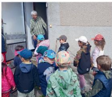
Motýlci při návštěvě senierek k příležitosti Dne matek.