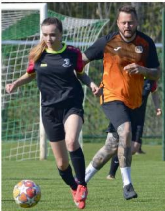
Během jednoho ze svátečních odpolední si borovští muži zahráli proti výběru žen Vysočiny.

hráčů, snad minout. V okresní lize pak B tým prohrál na minihřištích v Hněvkovicích a Rozsochatci, ale prohry jsme hodili za hlavu a několika dobrými výkony se vrátili do boje o čelo velmi našlapané tabulky. Příští rok chceme ale veškeré žáky vytřížit jinak než letos.