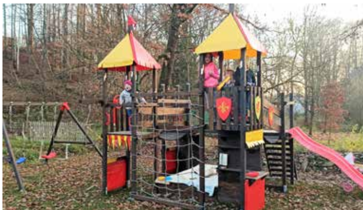
Dětskému hřišti v Peršíkově vévodí hrádek s množstvím herních prvků.