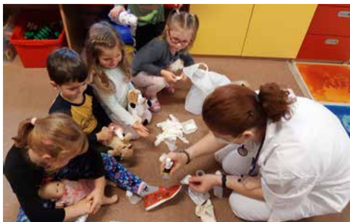
Třída Sluníček se proměnila v nemocnici pro plyšáky.