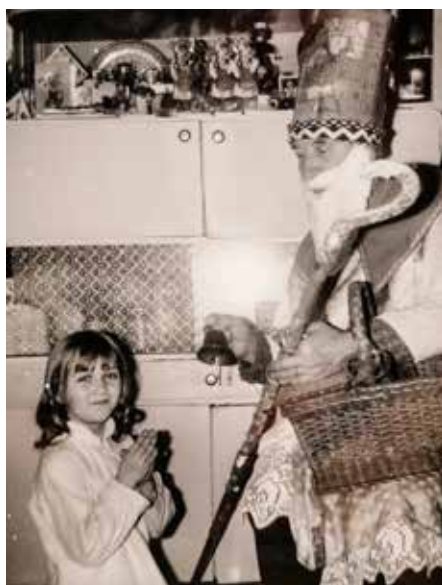
Dupání, cinkání zvonku a mulisy mulisy, to si pamatují mnozí z nás z dětství...

Dobře si pamatuji, jak jsem v prosinci roku 2015 vyrazil s panem