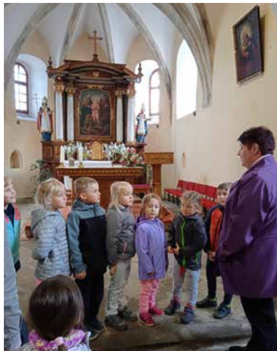
Berušky si prohlédly borovský kostel a pozorně naslouchaly poutavému výkladu paní Hájkové.