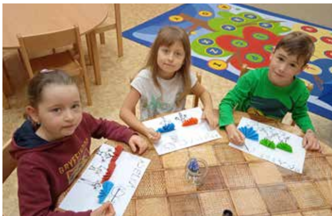
Když je deštiček, vezmeme si deštníček.