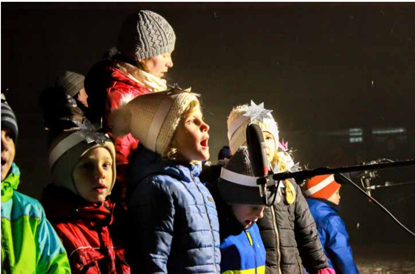
Rozsvícení vánočního stromu předcházelo krátké, ale moc milé vystoupení dětí z borovské školky. Sice se trošku bály přítomných čertů, ale na očích jim bylo vidět, jak moc se těší na Vánoce. A my všichni se těšíme s nimi. Ať jsou prožité ve zdraví, klidně a veselí!