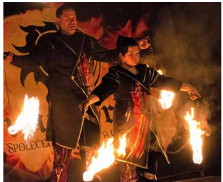
Ohnivá show v provedení taneční skupiny Novus Origo.