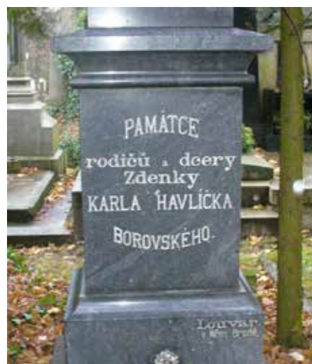
Havlíčkův Brod – náhrobek

Na Starém hřbitově v Havlíčkově Brodě u kostela sv. Vojtěcha se nachází hrob rodičů Karla Havlíčka, tedy kupce Matěje Havlíčka (1792 - 1844)