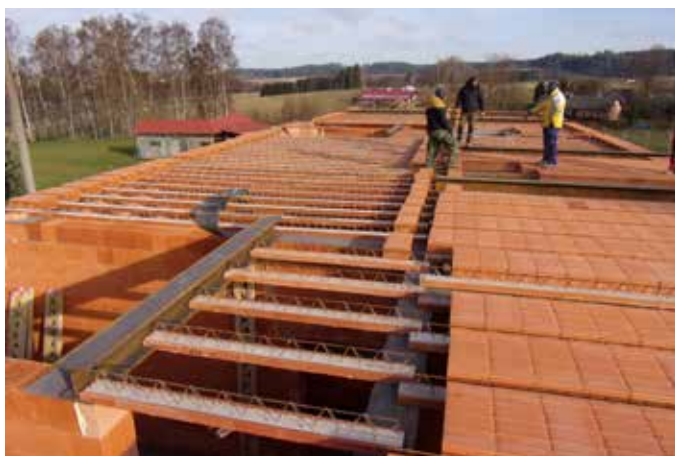
Přípravy na zalití stropu MŠ.