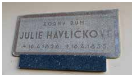
Svojšice – pamětní deska