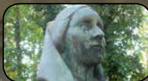
Památky na KHB, str. 10