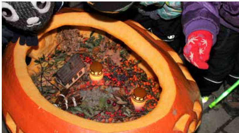
Tradiční Uspávání broučků pro rodiče s dětmi.