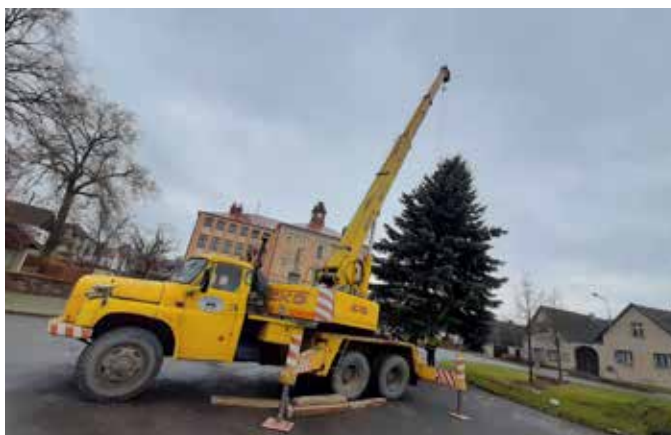
Konec listopadu se neobešel bez postavení vánočního stromu na náměstí a jeho nazdobení.