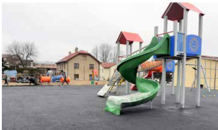
Téměř hotové dětské hřiště bude oficiálně otevřeno zjara.