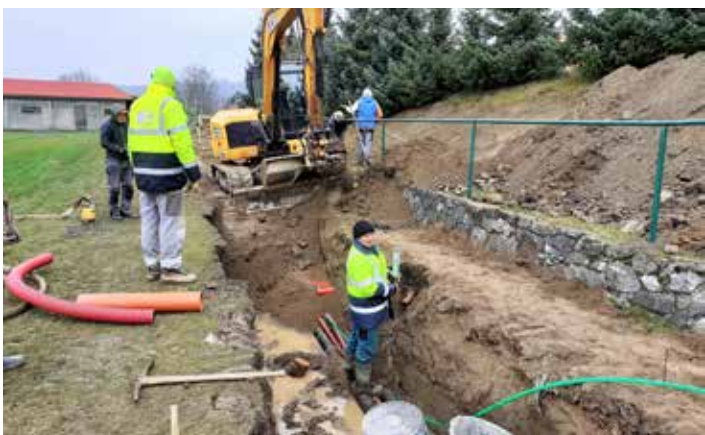
K tribuně a vrtům pod hřištěm nyní vede elektrika, optika, kanalizace i teplovod.