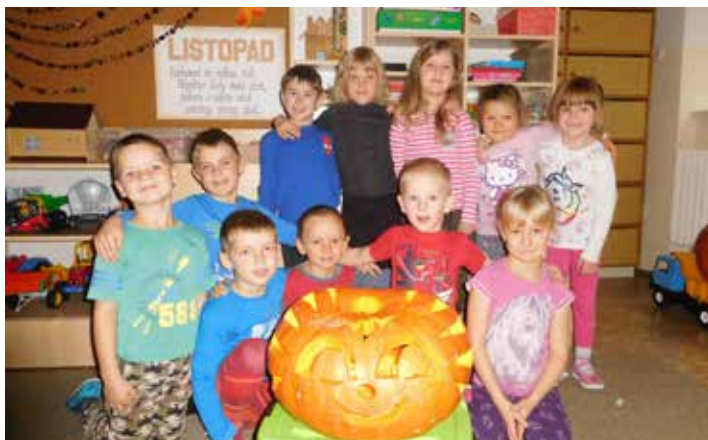
Berušky si užívaly čas vyřezáváním dýní.