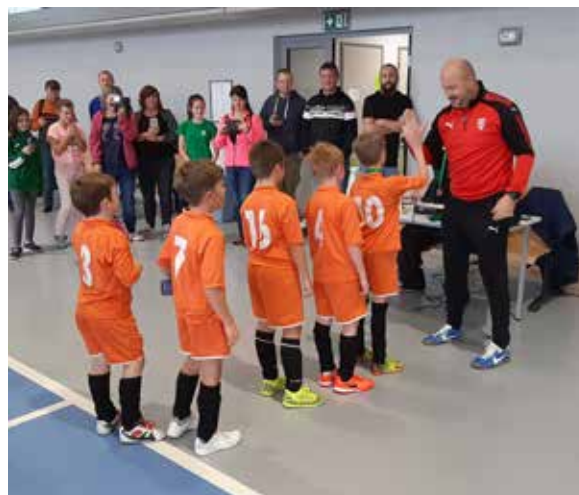
TURNAJ VE SVĚTLÉ. Několik hráčů mladší přípravy TJ Sokol Havlíčkova Borová se na počátku listopadu zúčastnilo miniturnaje Okresního fotbalového svazu. V krásné a moderní hale ve Světlé nad Sázavou obsadil náš tým s jedinou prohrou druhé místo.