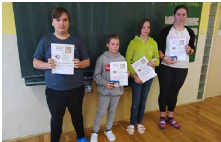
Vítězové matematické Pythagoriády.