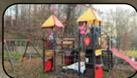
Dráčkovské hřiště, str. 6

www.havlickovaborova.cz * urad@havlickovaborova.cz * 569 642 101