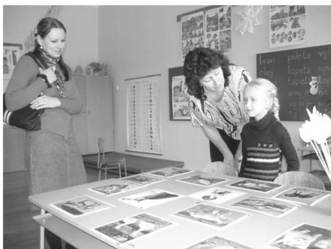
Maminka s dcerou při pondělním zápisu

Fotografie ze školních akcí, články a další užitečné informace najdete na stránkách ZŠ a MŠ na adrese http://zborova.ic.cz