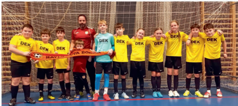
Starší příprava se v lednu zúčastnila halového turnaje ve Skutči, odkud si odvezla bronzové medaile. Statečně se držela proti FK Pardubice a porazila třeba Kutnou Horu.