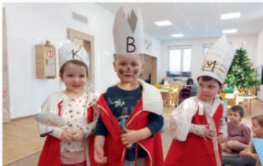
Tři králové ve třídě Sluníček.