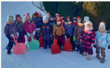
Zimní radovánky ve třídě Motýlků.