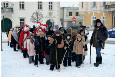
Vánoční hru Čtvrtý z mudrců hráli farníci z Velké Losenice a Havlíčkovy Borové začátkem ledna v Havlíčkově Brodě.