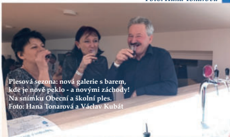
Plesová sezona: nová galerie s barem, kde je nové peklo - a novými záchody! Na snímku Obecní a školní ples.