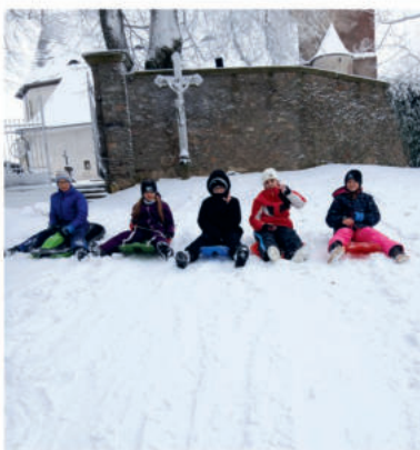
Zimní radovánky. Od pondělí 24. prosince ožil kopec pod kostelem, neboť bobovat a sáňkovat sem každý den chodila spousta dětí.