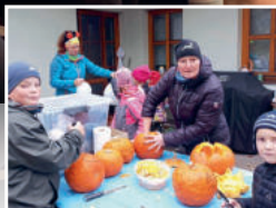
Dýňování s Trojháčkem, str. 13