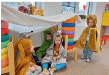
Sluníčka si zahrála pohádku Boudo budko.