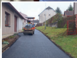
Stavební práce v obci, str. 6