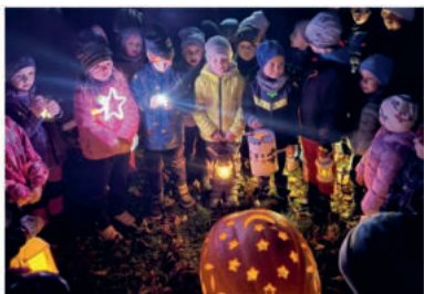
Uspávání broučků.