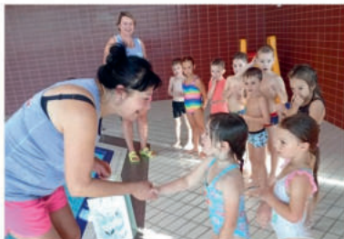
Žabky zakončily plavecký výcvik.