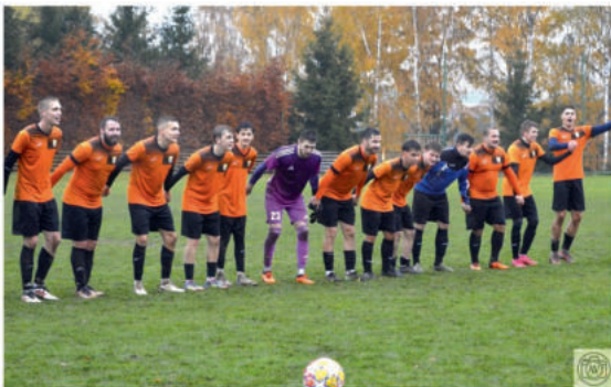
Takto se radovali hráči A týmu po remíze s lídrem tabulky.

Naše U11 patří v soutěži mezi nejlepší celky a v tréninku