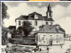
Druhý život Lidic, str. 7