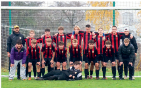
Starší dorost U19 se v krajské soutěži drží uprostřed tabulky.