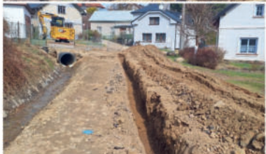
Postup prací v březnu.