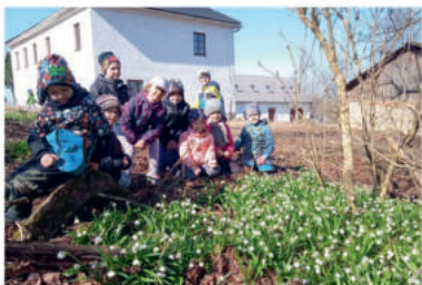
Žabky na vycházce na bledule.