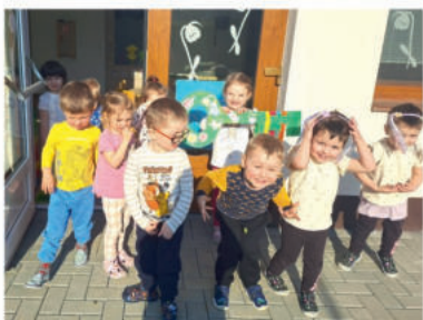
Sluníčka odemykala jaru vrátka.