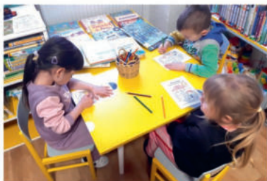
Motýlci na návštěvě v knihovně.