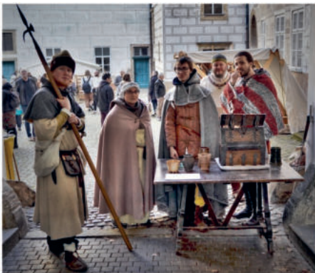
Festival zaniklých řemesel v Brandýse nad Labem. Najdete na snímku nějakou borovskou tvář?

Ten plánuje pokračovat v pořádání festivalu i nadále. Každý rok chce obměnit pár účastníků, aby přijeli noví lidé s novými nápady, a přivést na zámek další nová řemesla.