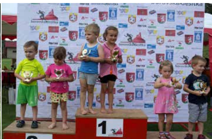
Budoucí běžecké naděje?