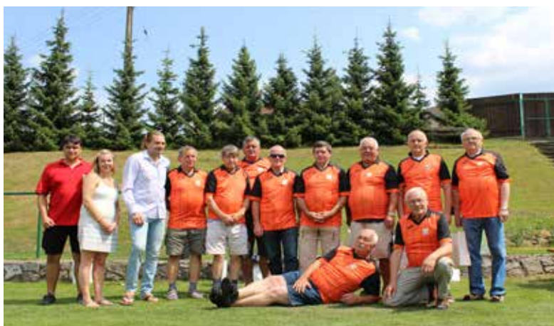
Oslavy 50. výročí fotbalu.