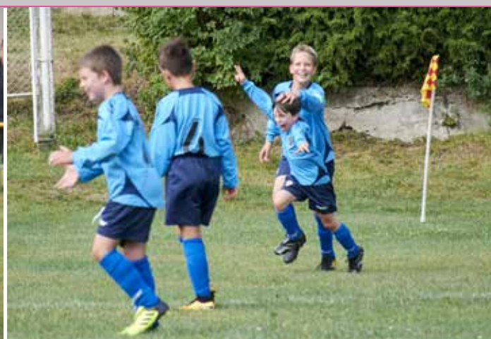
První vítězný zápas po prázdninové pauze odehráli mladší žáci ve Věžnici poslední srpnovou neděli.