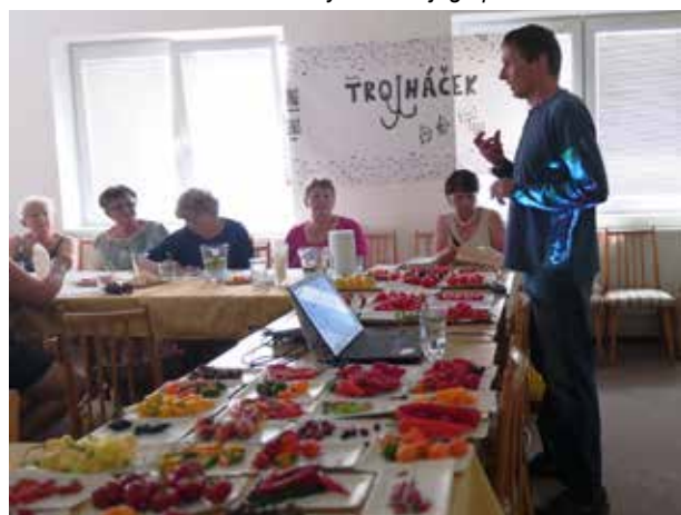
Přednášky byly doprovázeny názornou ukázkou.....