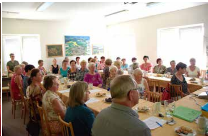
Přednášky po celé léto provázela vysoká účast.