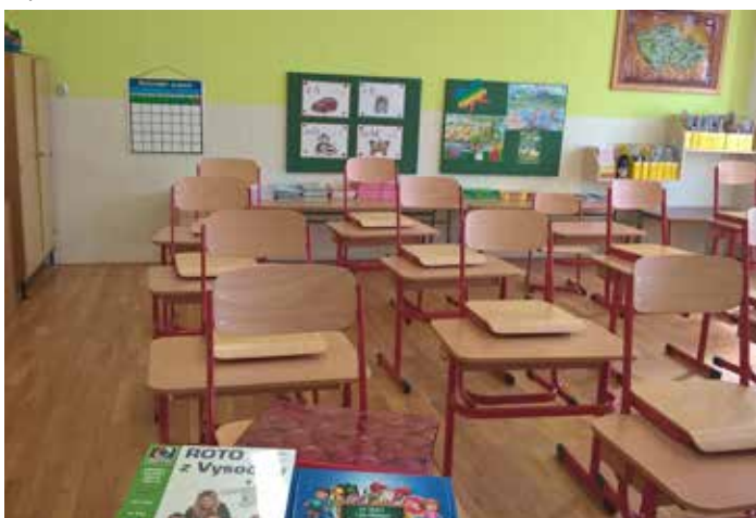
První třída po rekonstrukci.