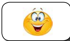
Poslední radosti místostarosty, str. 4