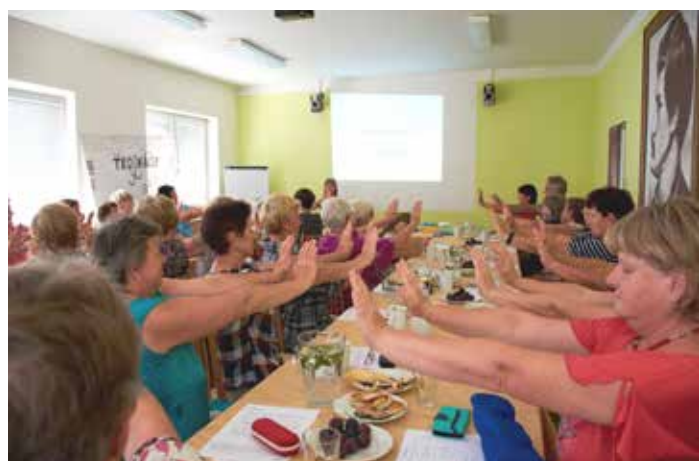
Létní škola seniorů senioři si vyzkoušeli jógu prstů.