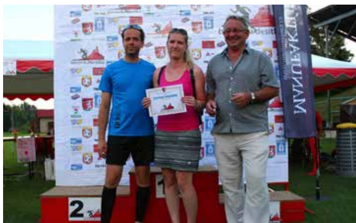
... pro FOKUS.