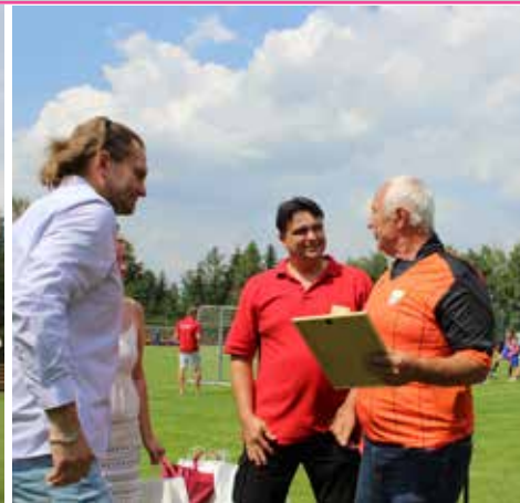
Oslavy 50. výročí fotbalu.