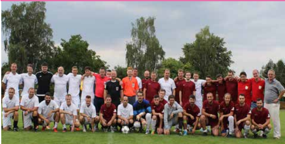
Borová proti výběru okresu.