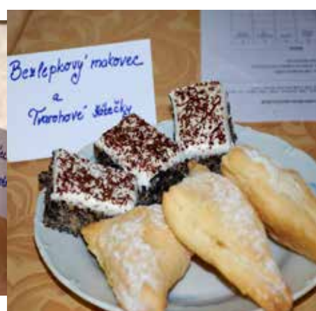
a výborným občerstvením.