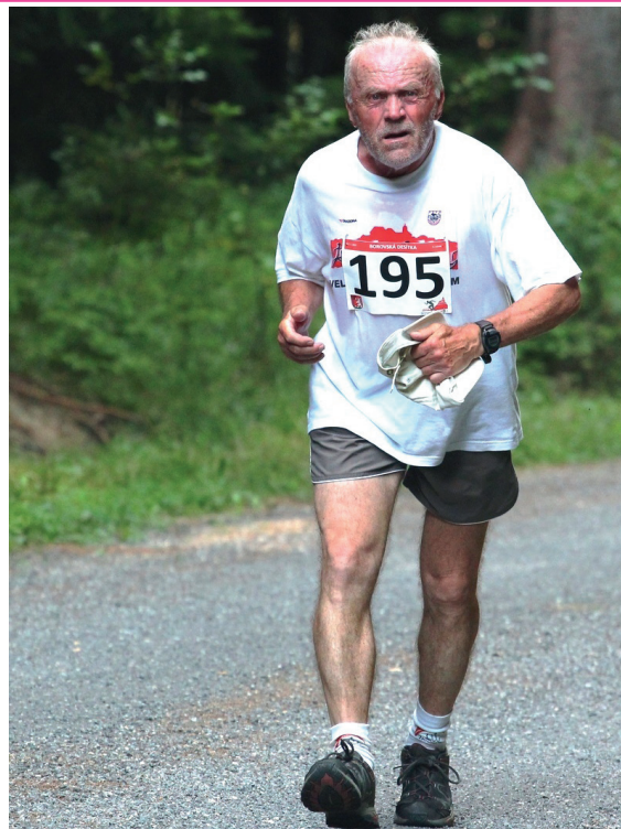
Závodníci na trati Borovské desítky neztráceli náladu ani v extrémním horku. Účastnily se všechny věkové kategorie.