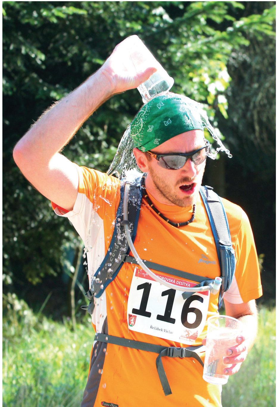
Závodníci na trati letošní desítky okusili extrémní horka.

BOROVSKÉ LISTY, MĚSÍČNÍK, NÁKLAD 500 KS, ZDARMA VYDÁVÁ MĚSTYS HAVLÍČKOVA BOROVÁ, IČO: 00267431. UZÁVĚRKA 20. DEN V MĚSÍCI. TISK ZAJIŠTUJE TISKÁRNA V RÁJI, PARDUBICE, www.tiskarnavraji.cz. TITUL ZAPSÁN DO EVIDENCE PERIODICKÉHO TISKU; REGISTRAČNÍ ČÍSLO PŘIDĚLENÉ MINISTERSTVEM KULTURY: MK ČR E 20838