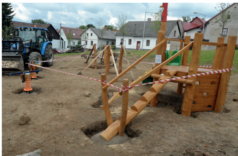
Instalace herních prvků v ulici Na Výsluní.