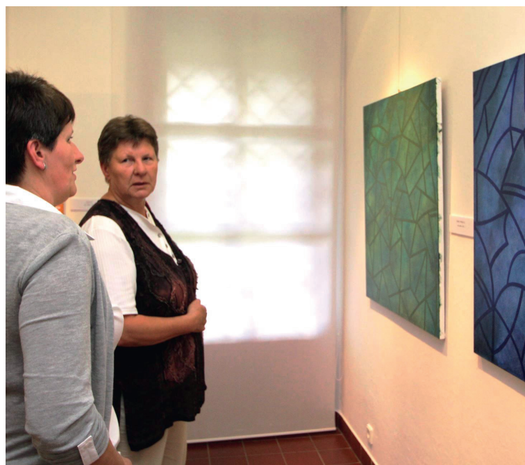
Havlíčkobrodská vernisáž Filipa T.A.K.