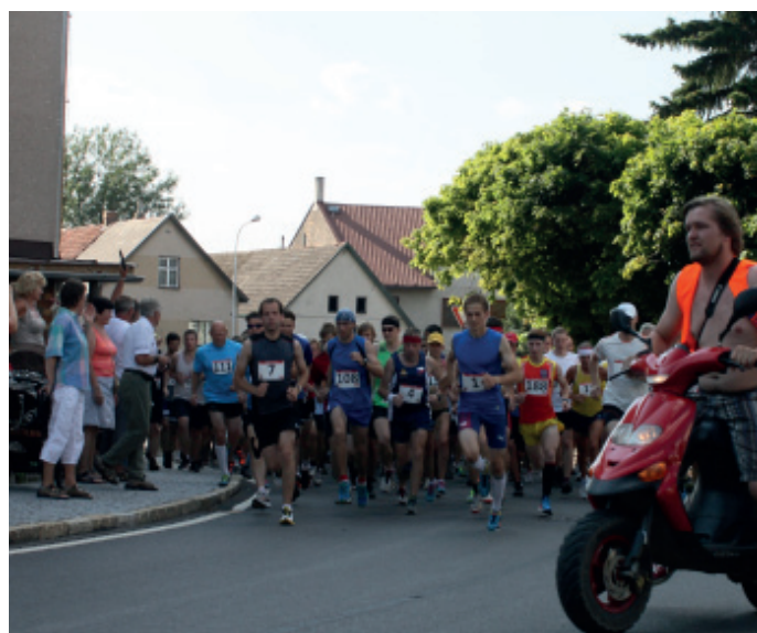
Start závodu.