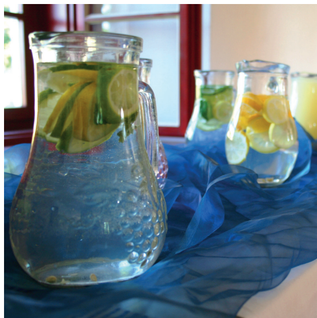
Dětské odpoledne v podání JenTaku na borovské faře - nechybělo malování na obličej ani letní občerstvení.