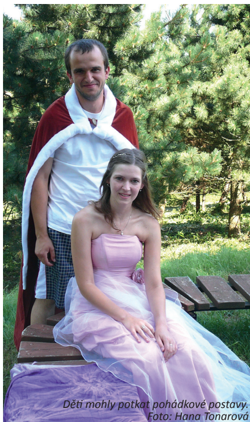
Děti mohly potkat pohádkové postavy.