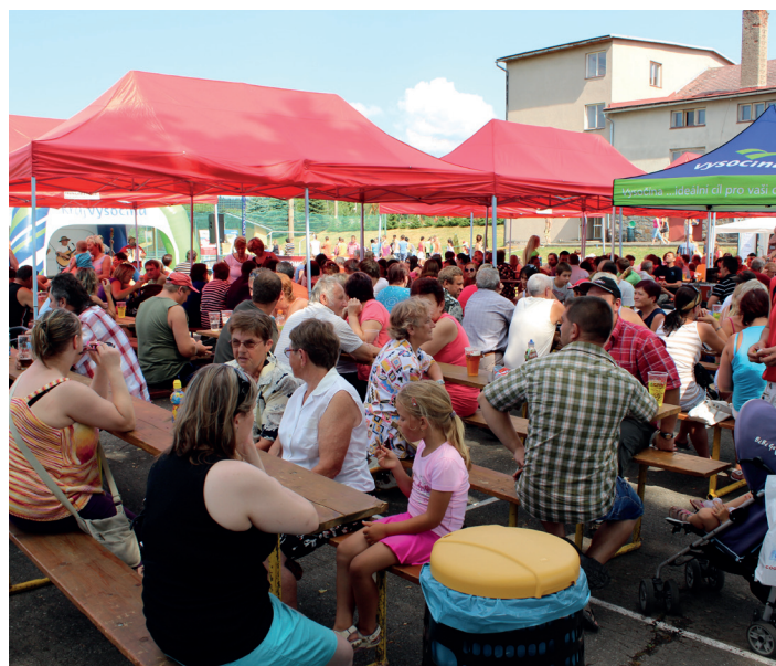
Letní dovádění s Rádiem Vysočina první srpnovou neděli.