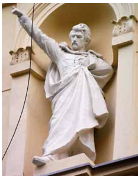
Praha – Nitranská ulice