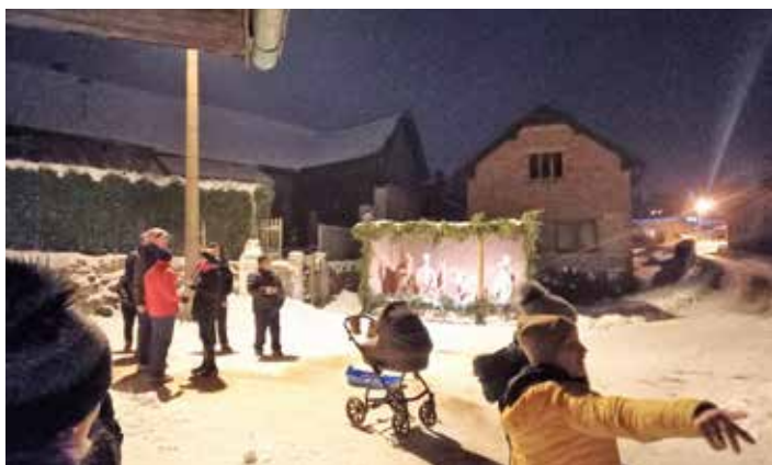
Vánoční sousedské setkání se konalo každou adventní neděli u slaměného betlému u kapličky v Peršíkově.