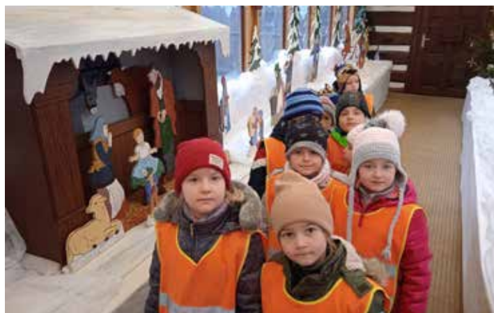
Berušky navštívily Výstavu betlémů v České Bělé.