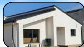
Tornádo na Moravě po půl roce, str. 13