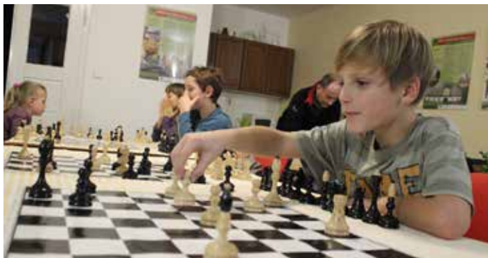
Šachový kroužek pro děti funguje v Havlíčkově Borové už od poloviny devadesátých let. Dnes se malí šachisté scházejí každou středu od 15:30 v „Lukšovce“ a s chutí přivítají další zájemce jakéhokoliv věku.