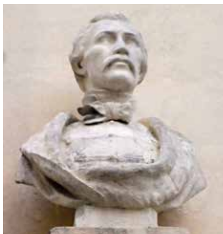
Praha – ulice U božích bojovníků

vždy obvyklého vymodelování očí) je na čelní straně budovy situované do náměstí Míru s kostelem sv. Ludmily. Je instalována v řadě celkem pěti bust významných Čechů umístěných mezi sloupy před kruhovými okny třetího patra ve výšce zhruba patnácti metrů nad zemí a je chráněna sítí proti náletu holubů. Společnost zde Havlíčkovi dělají při čelním pohledu zleva Miroslav Tyrš, František Palacký, Bedřich Smetana a Josef Kajetán Tyl. Borovský je v této řadě druhý zleva a pod římsou, nad níž je jeho busta osazena, lze přečíst nápis: „K. HAVLÍČEK BOR.“ Budova Národního domu se třemi reprezentativními sály a čtyřmi společenskými salonky je dnes kulturním a společenským centrem a národní kulturní památkou.