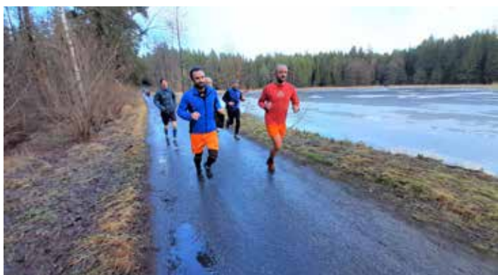
Příjemnou tradicí je odpolední „Silvestrovský výběh Borovské desítky“. Stejně tak tomu bylo i letos a na trati bylo možné potkat nejen běžce, ale i rodiny s kočárky nebo cyklisty.