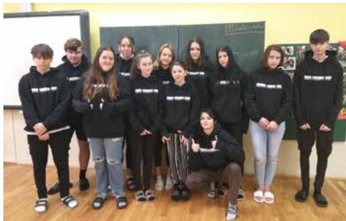
Devětáci v absolventských mikinách.