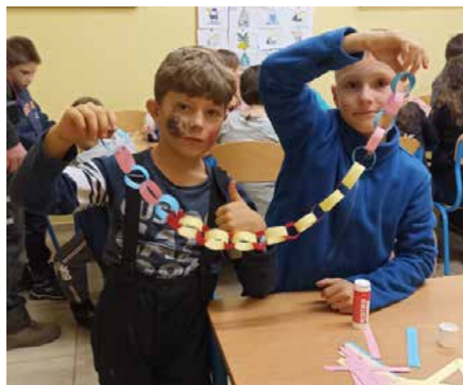
Předvánoční schůzka se nesla ve znamení výroby ozdob na stroměček, cukroví a pohody.