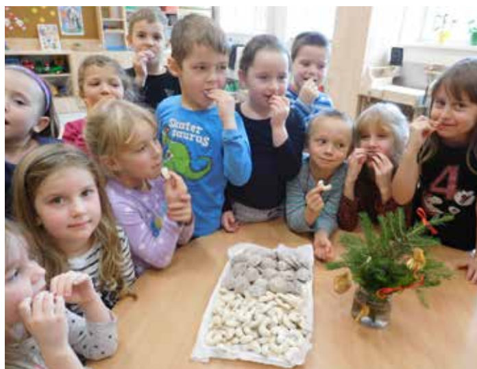
Předškoláci si upekli pracny a vanilkové rohlíčky a moc si na nich pochutnali.