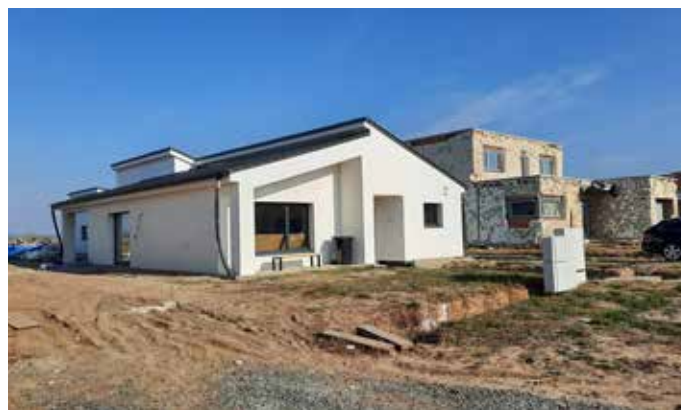
... a v prosinci. Foto: Jitka Pešková 2x