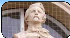
Památky na KHB, str. 10