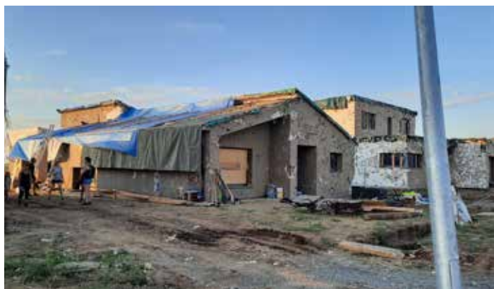
Před půl rokem....