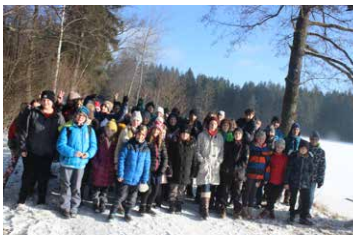
Žáci 2. stupně vyrazili 22. prosince k Podhoráku.