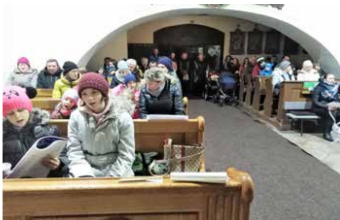
Malá, neoficiální zkouška koled se uskutečnila 23. prosince v kostele. Zpívali jsme si neznámější koledy, abychom si oživila slova před štědrovečerními rodinnými koncerty u stromečku.