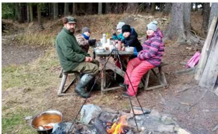
V prosinci si myslivečci pochutnali přímo v přírodě na kotlíkovém guláši. Více na str. 13.