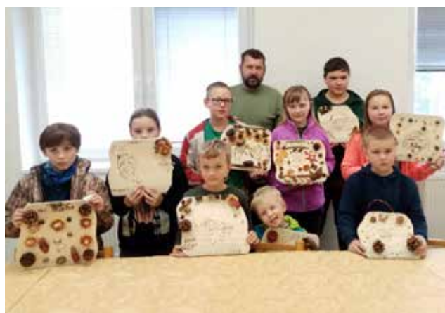
Myslivečci jedno setkání věnovali i výrobě dáreků pro své blízké – stylově vypalovali obrázky na dřevo.