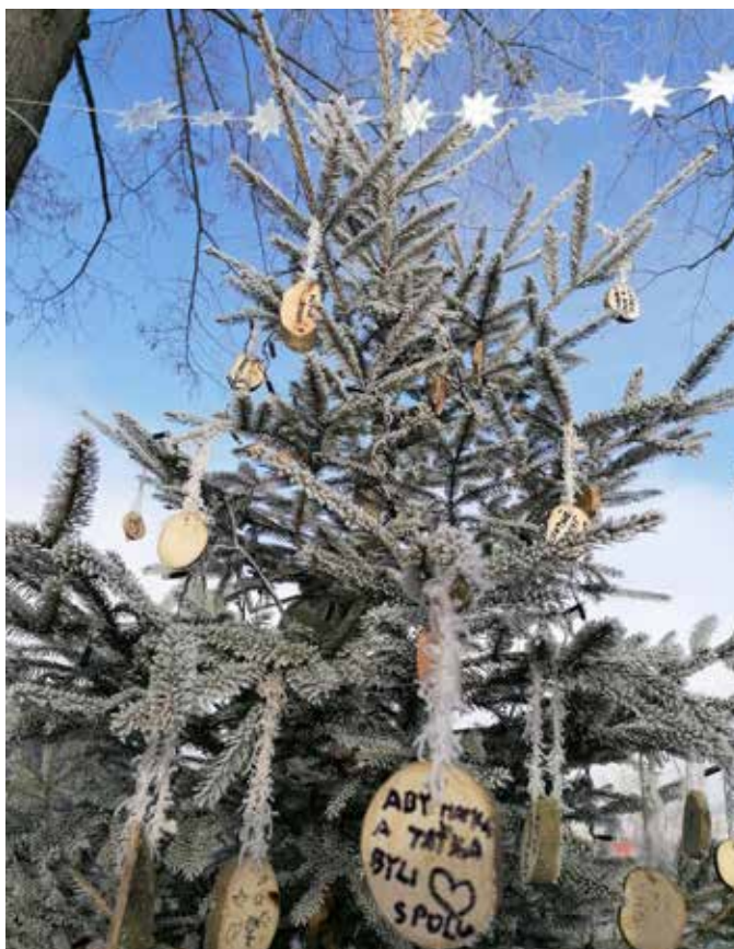
Strom přání se během Vánoc rozsvítil v aleji u Vodárny.