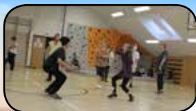
Novinky ze školy, str. 8

www.havlickovaborova.cz * urad@havlickovaborova.cz * 569 642 101