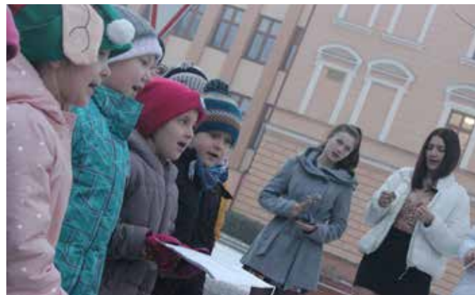
Žáci ZŠ zaspívali 22. prosince koledy u stromu na náměstí. Bude to nová tradice?