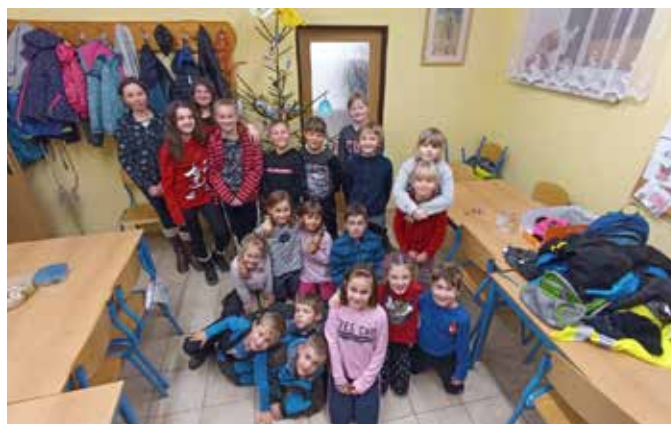
Mladí hasiči se sešli naposledy před Vánocemi a udělali si besídku s cukrovím a dárčky.