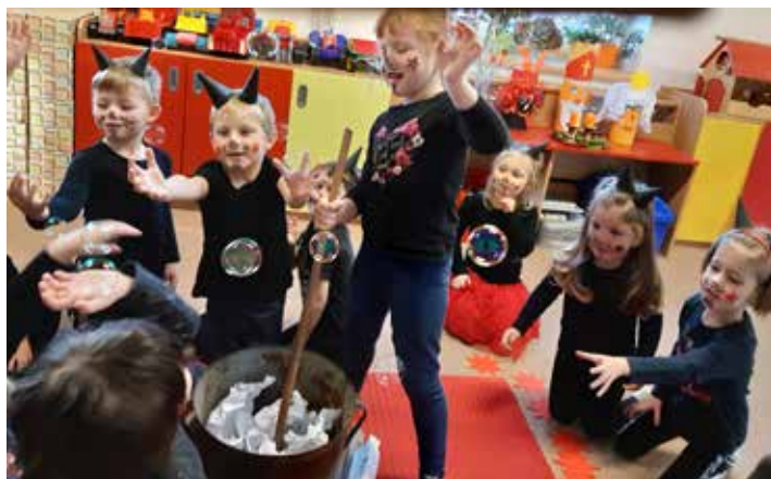
Peklo ve třídě Sluníček.