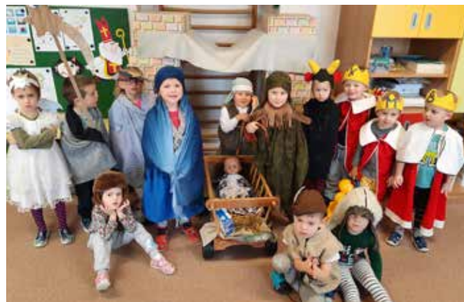
Sluníčka putovala do Betléma.