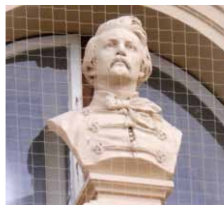
Praha – Korunní ulice