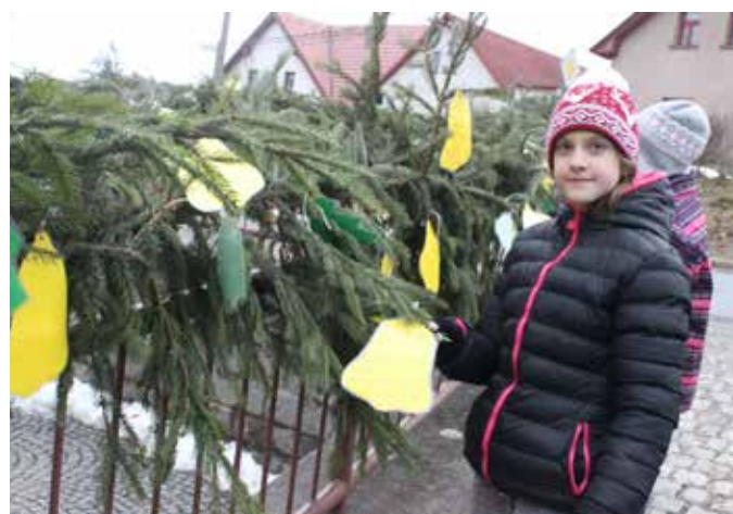
Čtvrtáci čtou vzkazy na ozdobeném zábradlí.