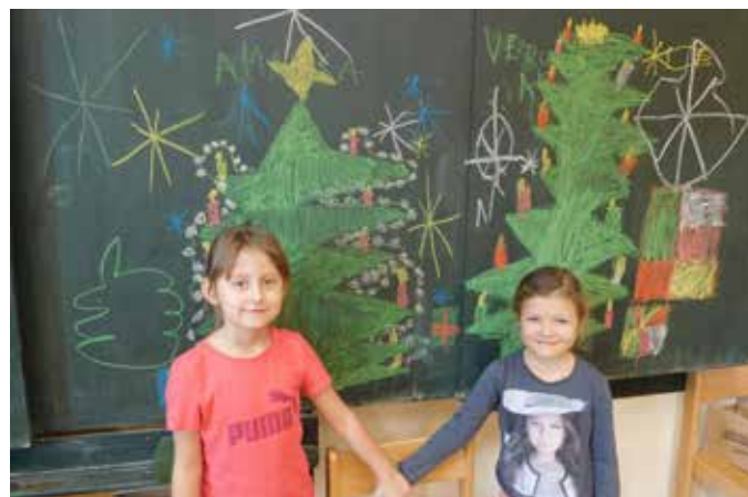
Pravá vánoční atmosféra v mateřské škole.